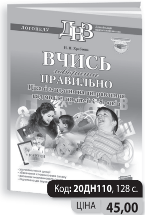
укр. мова, формат А4, м'яка ламінована обкладинка, повнокольорова