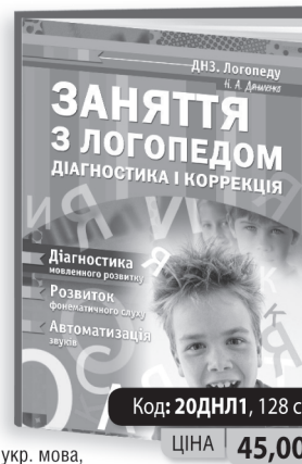
укр. мова, формат А4, м'яка ламінована обкладинка, повнокольорова