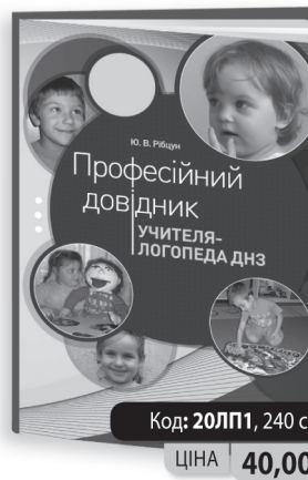
укр. мова, формат А5, м'яка ламінована обкладинка

Якісно складені посібники з логопедії задовольняють усі Ваші професійні потреби.